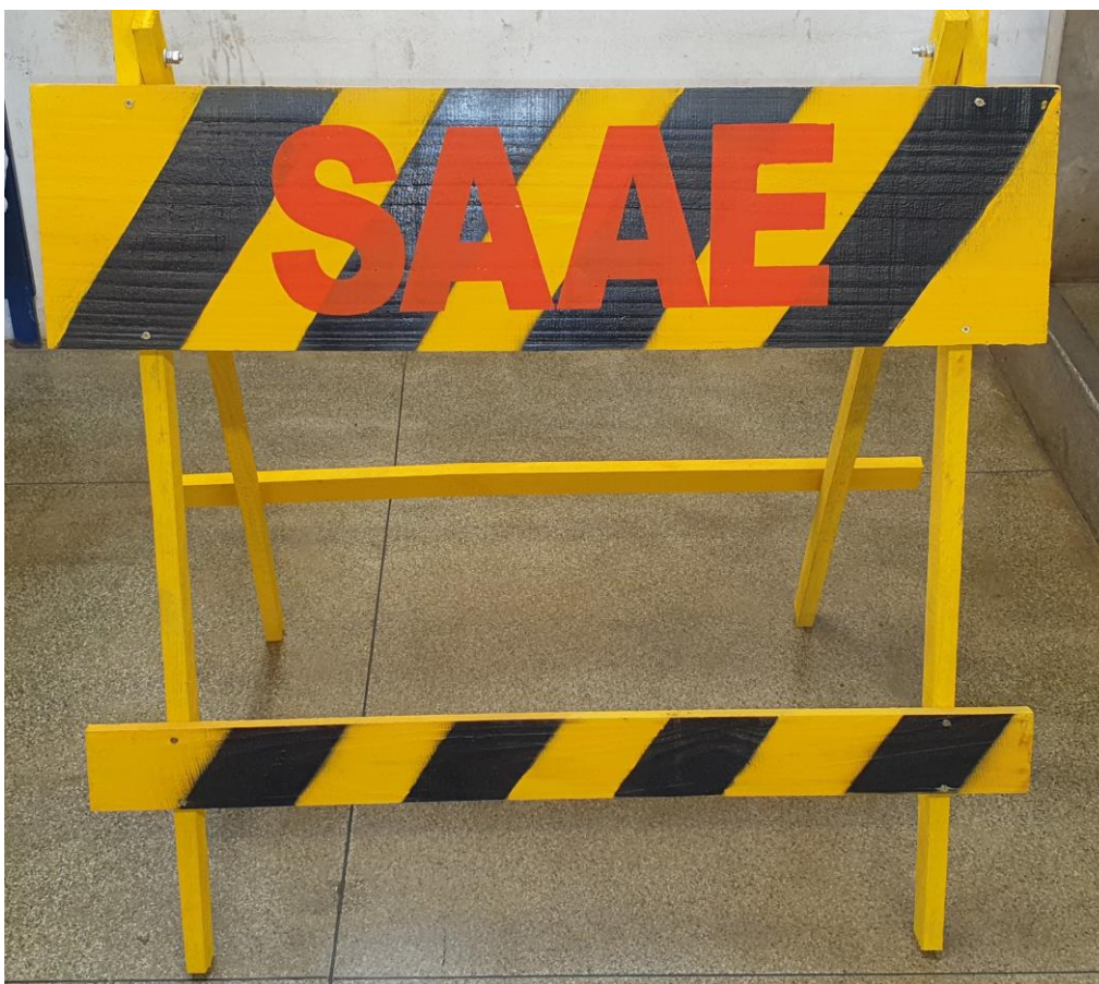
Figura 02: Frente do Cavalete.