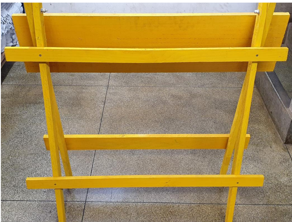
Figura 03: Atrás do Cavalete.