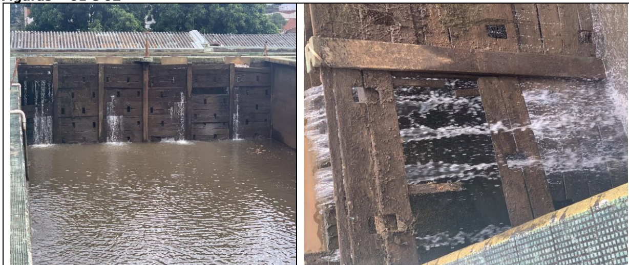
Figuras – 01 e 02

Como mostram as fotos abaixo (Figuras – 01 e 02), as comportas existentes encontram-se danificadas, o que prejudica significativamente a distribuição de vazão e, conseqüentemente, a eficiência do processo de sedimentação.