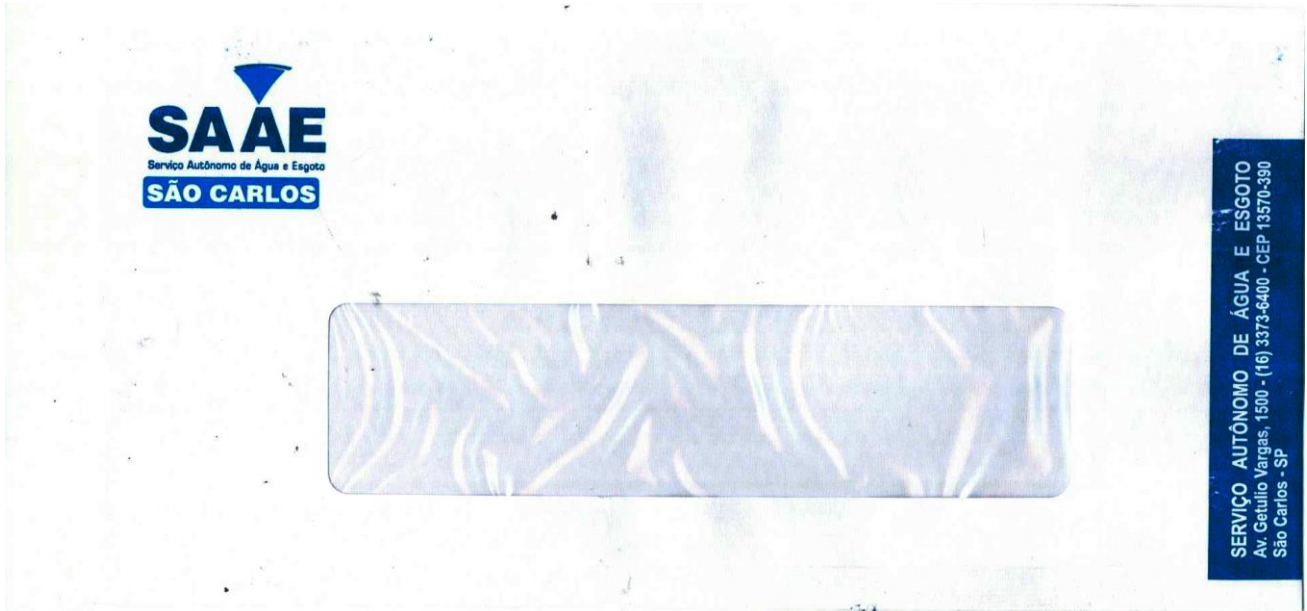
Figura 03: Layout do Talão de Ordem de Serviço