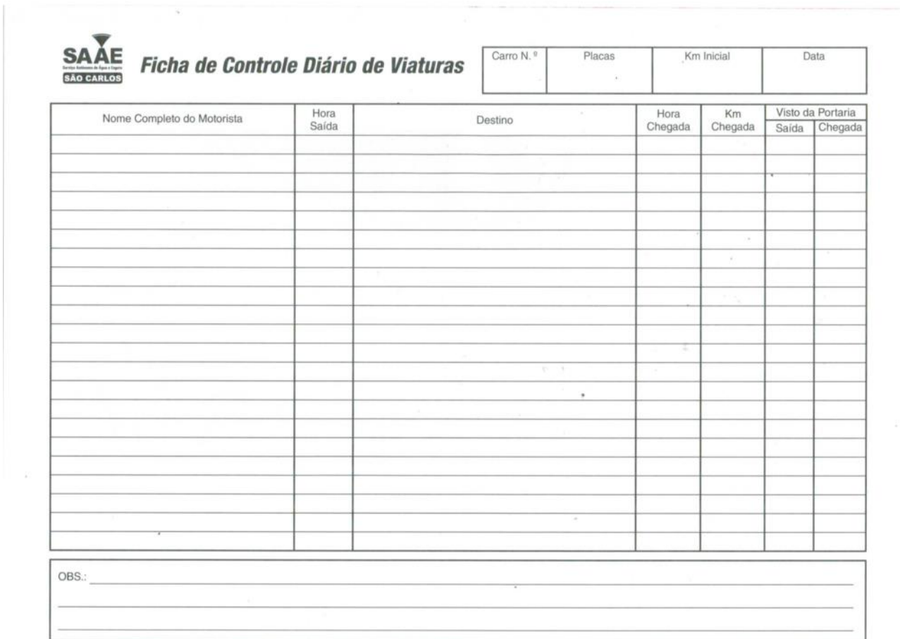
Figura 04: Layout da Ficha de Controle Diário de Viatura