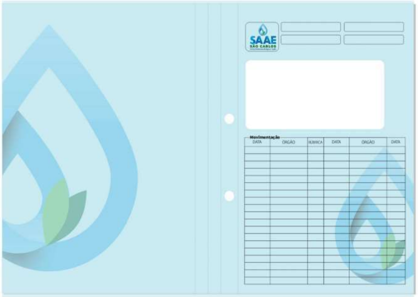
Figura 1: Layout de Capa para Processo.