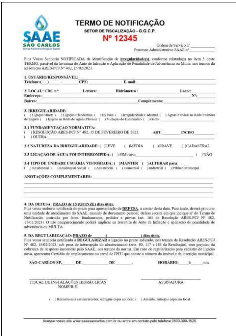
Figura 04: Layout de Termo de Notificação FRENTE.