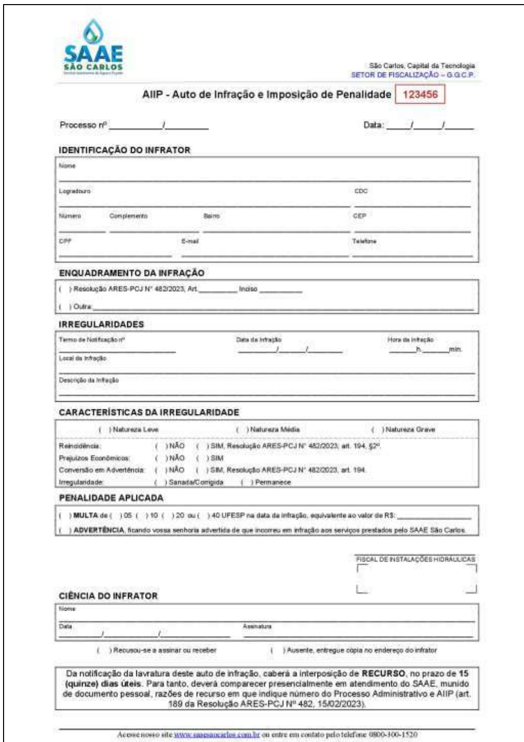
Figura 06: Layout de Auto de Infração.