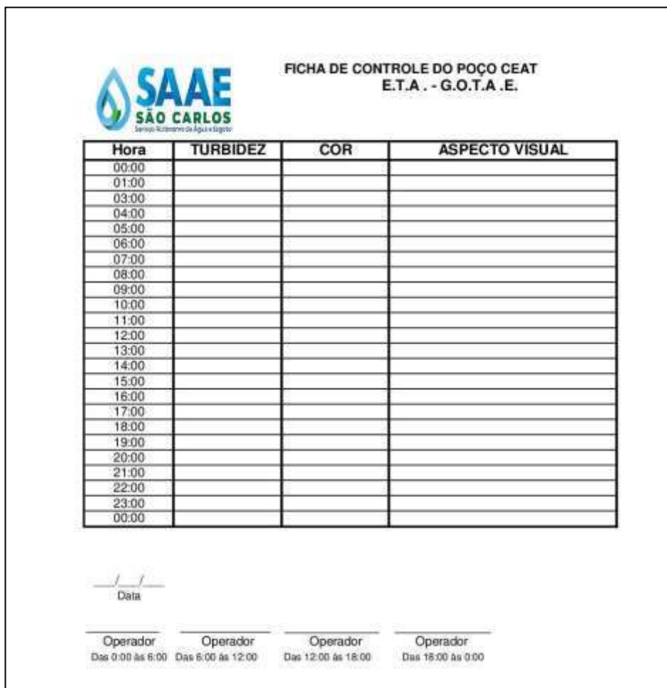
Figura 14: Layout da Ficha de controle do Poço CEAT.