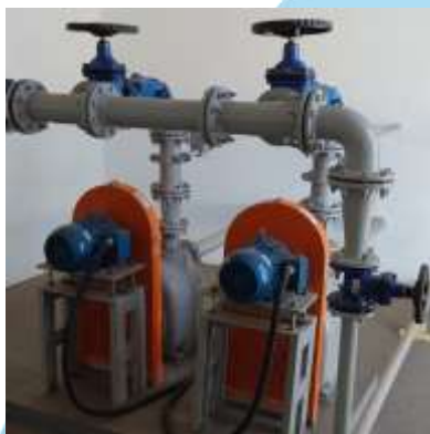
Figura 01: EEE Belvedere e EEE Jd. Progresso

O Conjunto Mecânico (Conjunto Girantes) em questão é a parte ativa da bomba. Na figura 01 apresenta-se um esquemático de sua montagem no corpo da bomba.